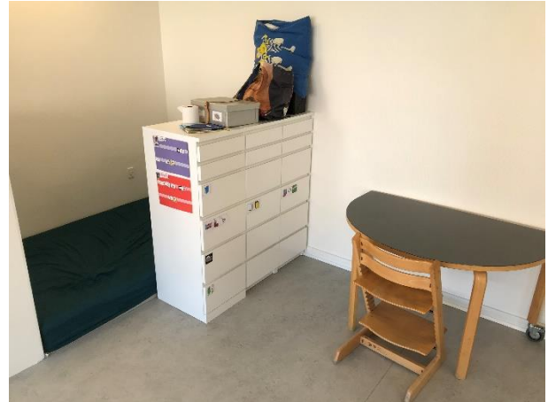
Læse- og iPad-hjørne