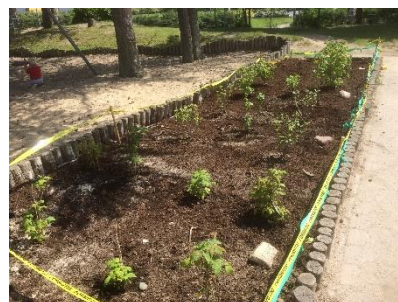
Nyanlagt frugt- og bærbed

På vores egen legeplads har vi en lille sandkasse, et lounge-område og en lille have, hvor vi har mulighed for at plante lidt bær og grøntsager. I haven kan vi også hænge en hængekøje og en hængekøjestol op.