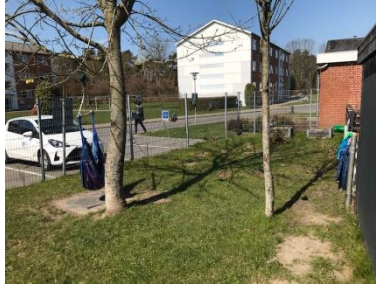
Hængekøjer og græsplæne til leg