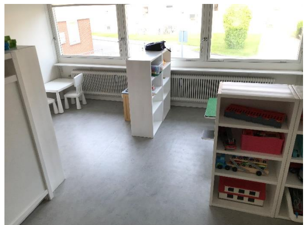
De tre andre legestationer