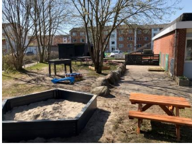
Sandkasse og fliser til løb og cykling