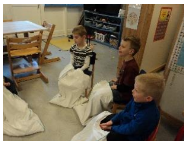
Fodbad uden vand