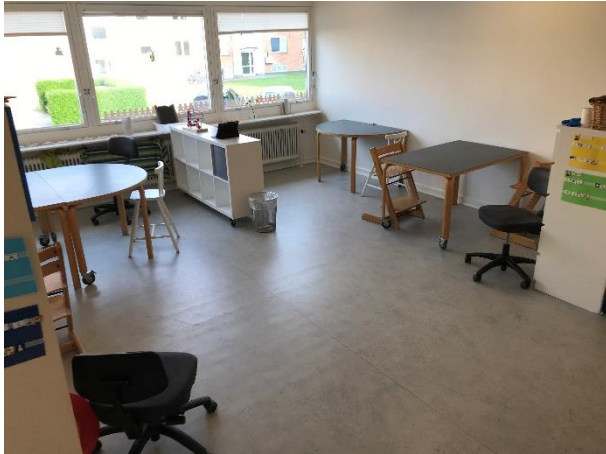
Borde til de forskellige aktiviteter samt gulvplads til de, der kræver det