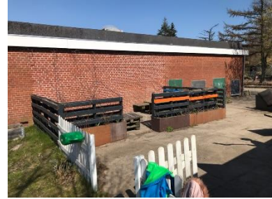
Lounge med læ og sol og bede med forskellige planter