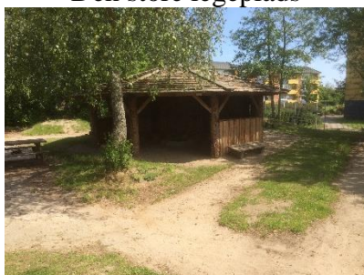
Cykelbane rundt om bålhytten